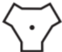
Symbole TACAN sur les cartes SIA et sur les cartes DIRCAM