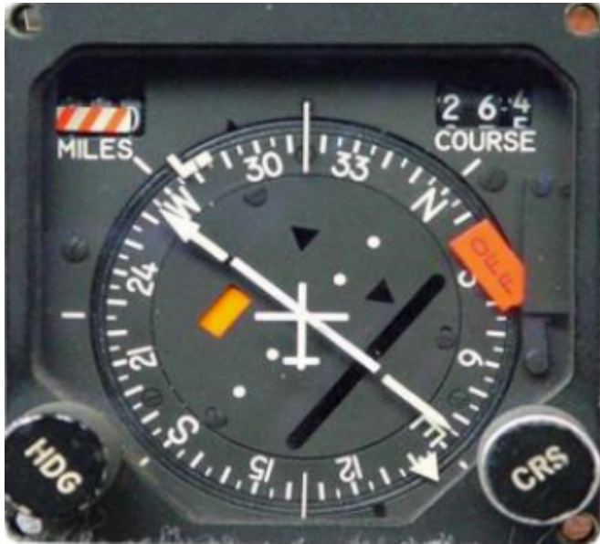
Indicateur de TACAN