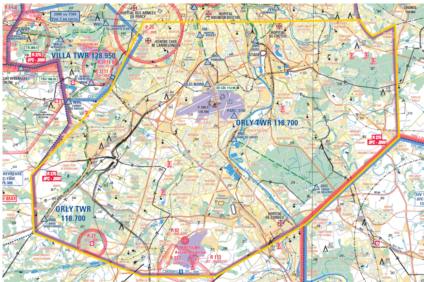
Voir Carte Itinéraire Hélicoptère - CTR Paris